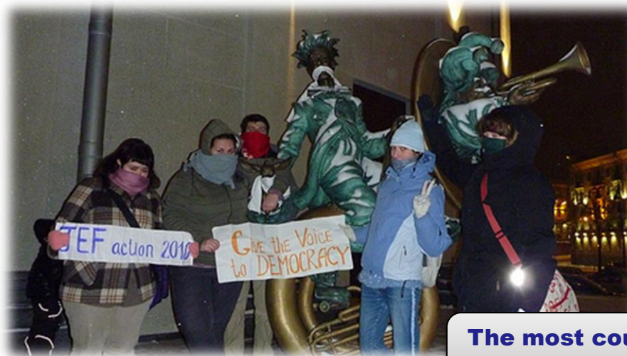
The most courageous picture Minsk/ Belarus