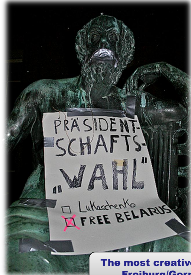
The most creative picture Freiburg/Germany