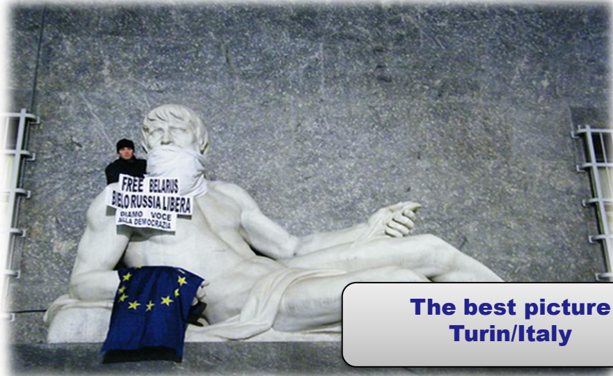
The best picture Turin/Italy